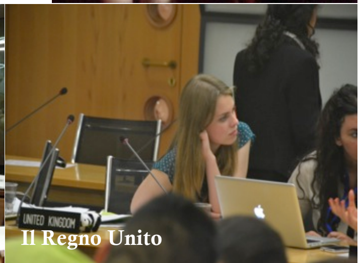
Il Regno Unito

Cerca tutte le informazioni sull'evento WIMUN 2014 sul sito della SIOI www.sioi.org e sugli account FB e Twitter collegati