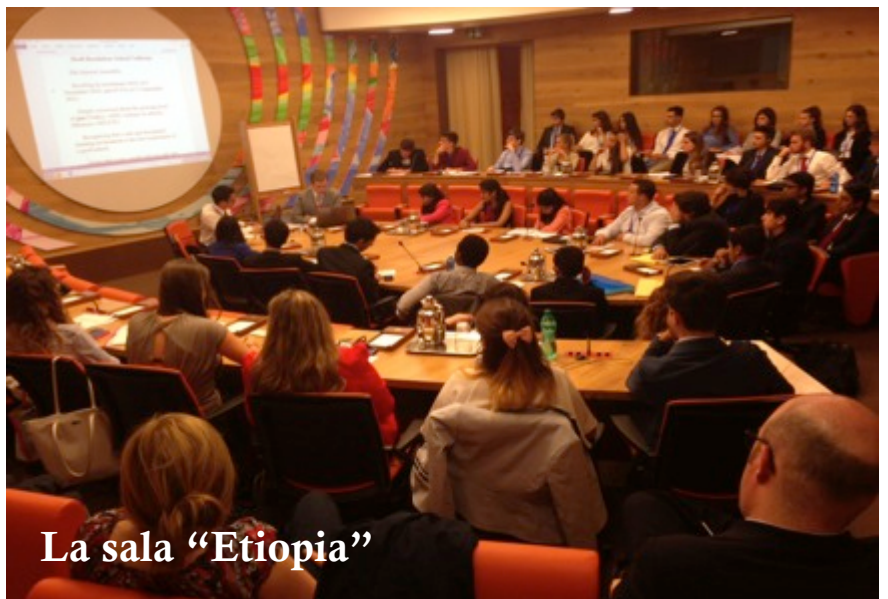
La sala "Etiopia"