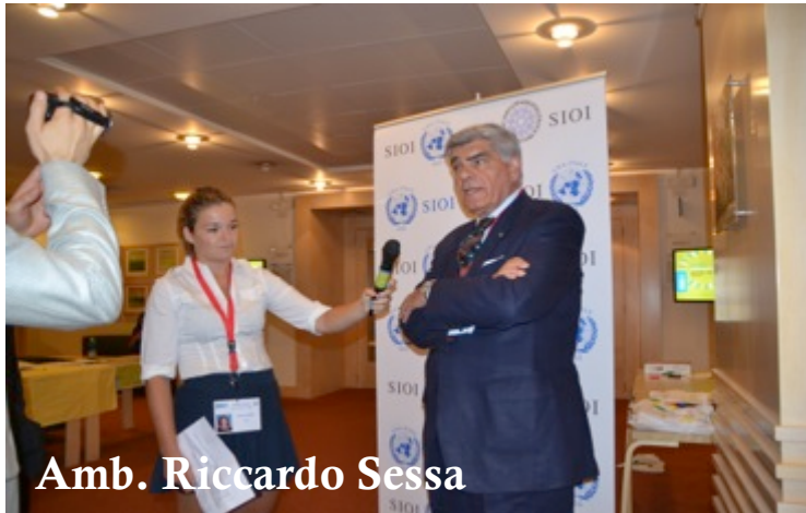
Amb. Riccardo Sessa

Lo sviluppo della collaborazione tra l'Italia e la Cina nella formazione di giovani alle carriere internazionali ed alle principali tematiche seguite dall'Organizzazione delle Nazioni Unite è stata affrontata a margine dei lavori della WIMUN 2014 in corso alla FAO. L'argomento è stato approfondito in un lungo e cordiale colloquio tra l'Ambasciatore Riccardo Sessa, Vice Presidente della SIOI, e l'Ambasciatore Lu Shumin, Vice Presidente dell'Istituto cinese degli Affari Esteri e Presidente dell'Associazione cinese delle Nazioni Unite (omologa della SIOI).