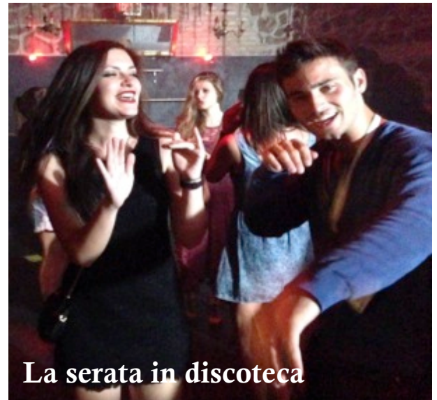
La serata in discoteca