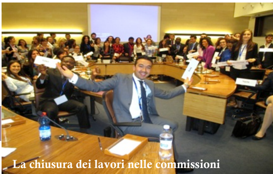
La chiusura dei lavori nelle commissioni