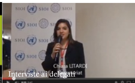
Interviste ai delegati