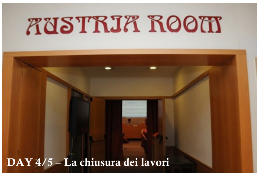
DAY 4/5 – La chiusura dei lavori

Ricorda che puoi leggerci anche su www.formiche.net